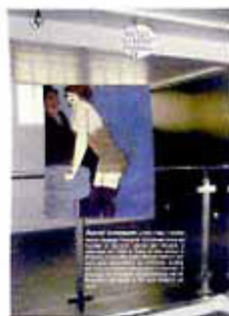
Exposition « David Schneuer », du Musée du Montparnasse, Paris XV, jusqu'au 23 janvier 2010.

Le musée du Montparnasse inaugure une galerie en mezzanine aménagée dans le hall d'entrée. Cette galerie est un espace de mémoire et de respect pour ces traces d'artistes héritière de la Belle Époque de Montparnasse sera un lieu permanent réservé à nos amis du musée, à ceux qui ont contribué à le défendre, à l'animer, souvent à lui confier des archives et des œuvres. Il sera aussi ce lien renouvelé avec les lieux voisins, avec les musées proches et les artistes témoin de la vitalité historique de ce quartier. La galerie sera complétée par la création de l'auditorium « Roger Picot », nom du fondateur du musée. Exposition « David Schneuer » en c