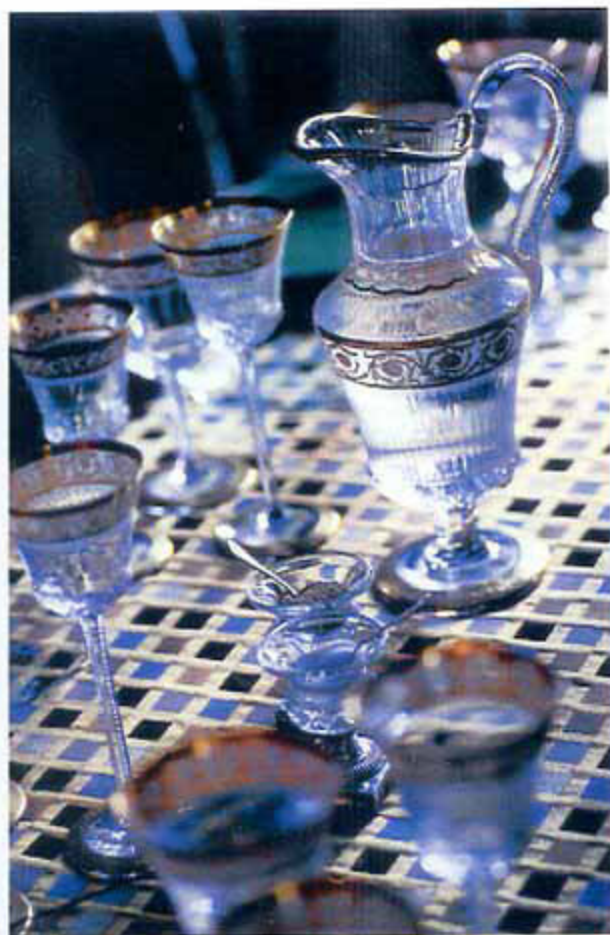
Sur une nappe de Rubelli, verres et carafe en cristal de Saint-Louis. Enfilade de portes, dans le fond, console vénitienne et tableau de Montebello. Dans la salle à manger, au mur, en tissus Fortuny d'époque et tapisserie d'Aubusson, lustre XIX e . Au milieu de la table, fontaine en tôle XVIII e .